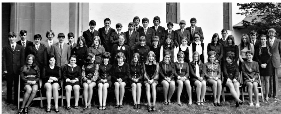
(als Nachtrag zur letzten Chiucheposcht hier noch die Konfirmand/innen aus dem Jahr 1972)